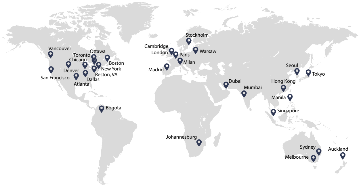
그림 2. 다크트레이스 글로벌 오피스 현황