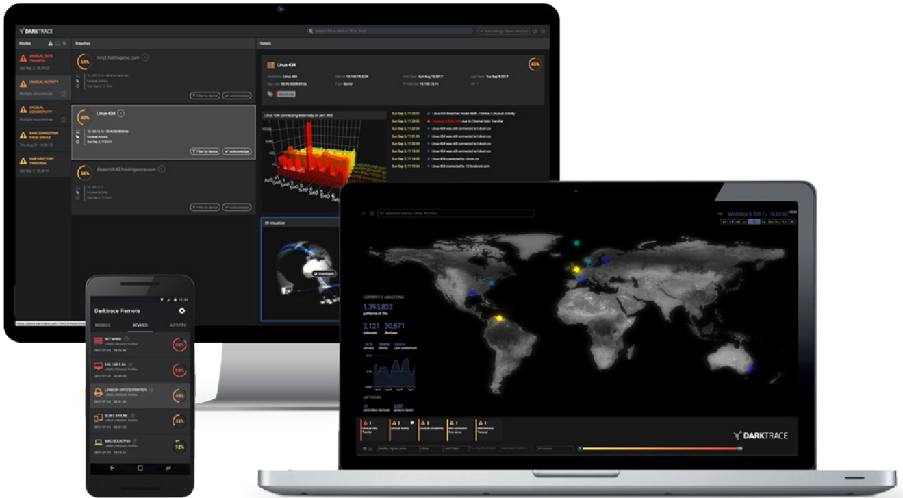
그림1. 다크트레이스의 위협 시각화 솔루션 화면 - 위협 탐지를 위한 실시간 3D 인터페이스